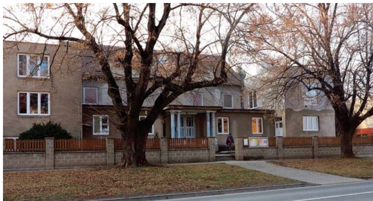
Sokolovna v současnosti