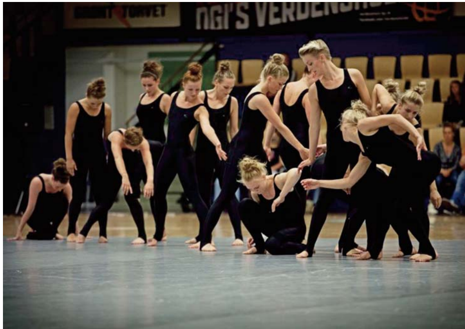
ČOS ve spolupráci s župou Jana Máchala a Sokolem Brno I připravují vystoupení dánského národního gymnastického týmu na úterý 28. května 2013 v hale na Kounicově ulici.

Další informace budou postupně zveřejňovány na webu www.zupapodripska.cz .