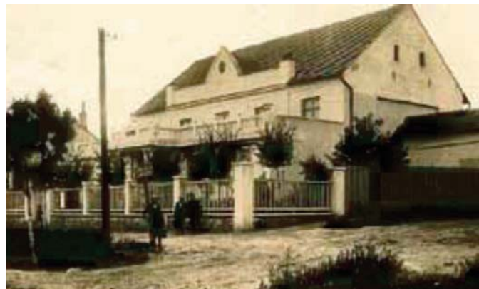
Sokolovna v roce 1934