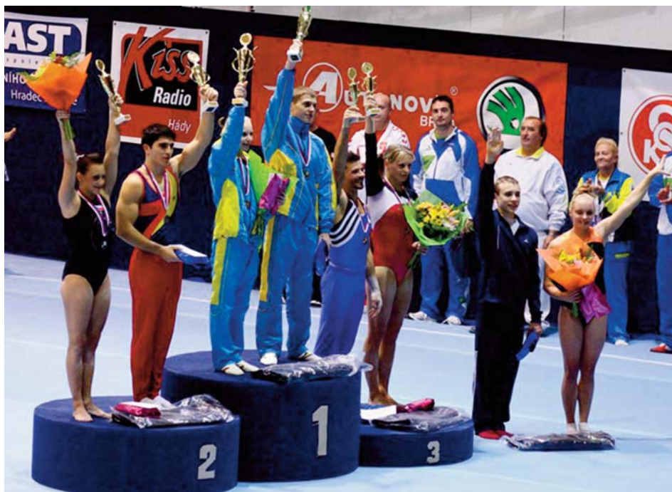
Nejúspěšnější účastníci Sokol GP Brno 2012