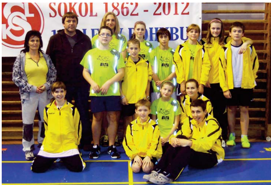
Výprava mladých badmintonistů a badmintonistek TJ Sokol Židlochovice se z přeboru ČOS v Plzni vrací s deseti medailemi.